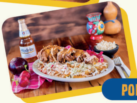
POLLO CON TAJADAS