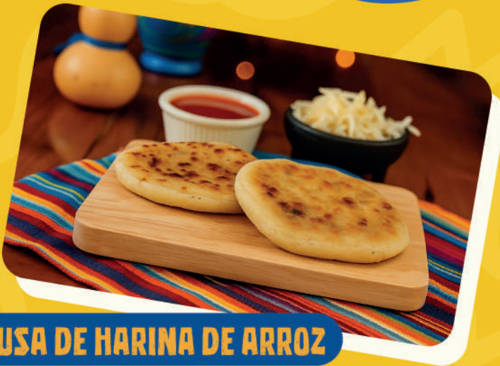
PUPUSA DE HARINA DE ARROZ