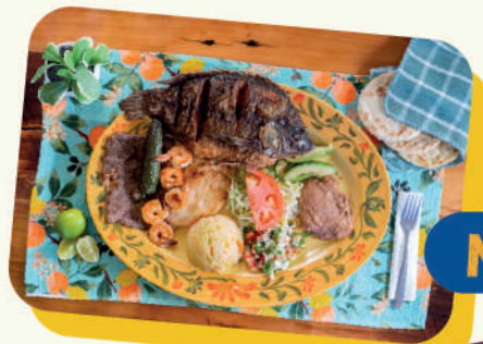
MAR Y TIERRA