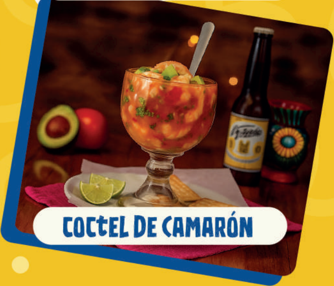
COCTEL DE CAMARÓN