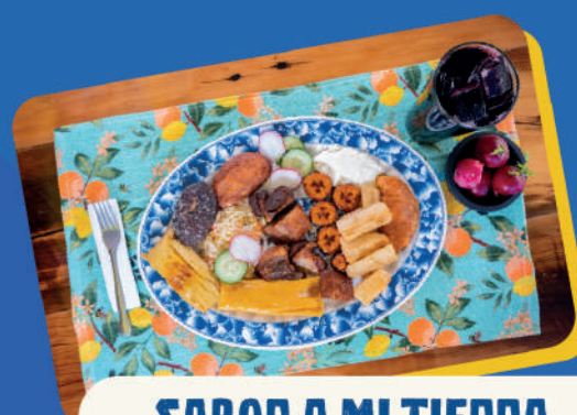
SABOR A MI TIERRA