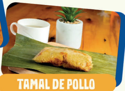
TAMAL DE POLLO